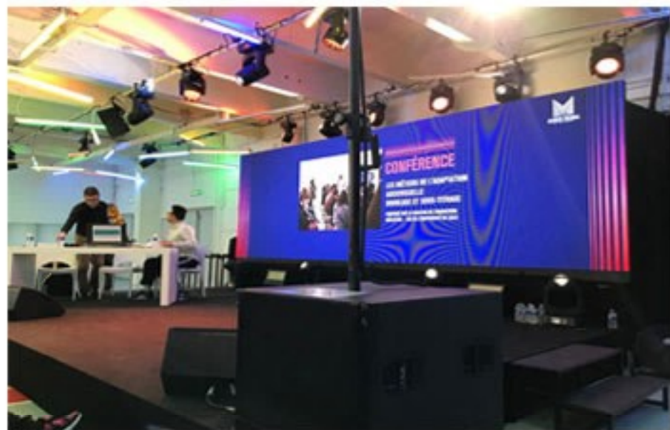
(Conférence interactive sur les métiers de l'adaptation audiovisuelle)

Après le débat, direction le Tripostal pour y découvrir des animations autour des séries ! Nous avons assisté à une conférence interactive sur les métiers de l'adaptation audiovisuelle (doublage, sous titrage) animée par des étudiants de l'Université de Lille.