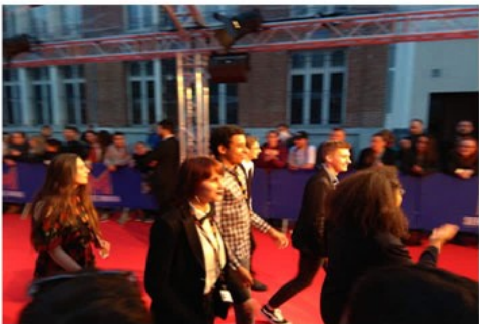
(Le jury lycéen sur le tapis rouge).

Après ce petit moment de gloire, nous sommes arrivés au Nouveau Siècle en présence de nombreux acteurs célèbres (Audrey Fleurot, Adam Scott, Ana Paquin ou encore Marti Noxon). Ce sont les acteurs de la série Scène de Ménage (diffusé sur M6) qui ont remis à