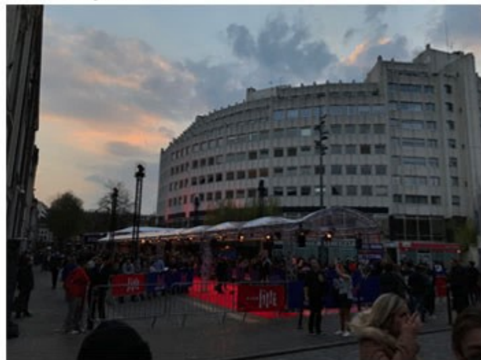
(Avant le tapis rouge au Nouveau Siècle).

Cette expérience fut réellement enrichissante. Elle m'a permis de comprendre plus en détail comment une série pouvait être mise en avant afin de se faire connaître. Être jury pour un festival n'est pas simple mais cela en vaut la peine !